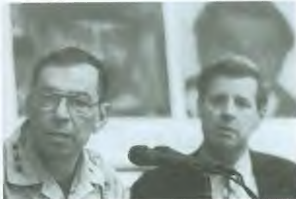
سانشينز وبريمر يعلنان عن القبض على صدام، 14 كانون الأول/ديسمبر 2003